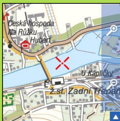
Turistická mapa obce