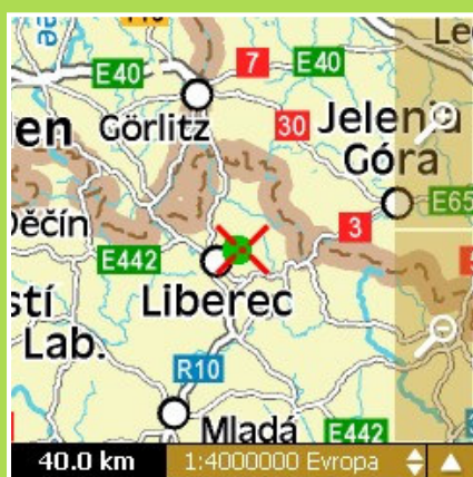
Přehledová mapa 1:4 mil